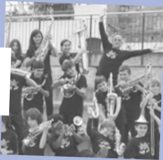
Sant Andreu Jazz Band